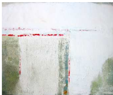
Kaseinarbeit von B. Neubauer