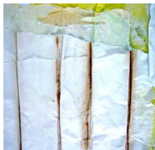
Papierarbeit von U.A.Schwartz