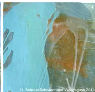
Wachsarbeit von U. Schulze Schwienhorst

Für alle Kurse kann ein Extrablatt angefordert werden, das den Kursinhalt nochmals ganz ausführlich und detailliert beschreibt. Wenn nicht gesondert erwähnt, so sind alle Malmittel, Farben, Werkzeugbenutzungen usw. in der Materialkostenpauschale enthalten. Zur Orientierung, für wen der jeweilige Kurs geeignet ist, sind M für „Malerfahrene“ und E für „Einsteiger“ jedem Kurs vorangestellt: