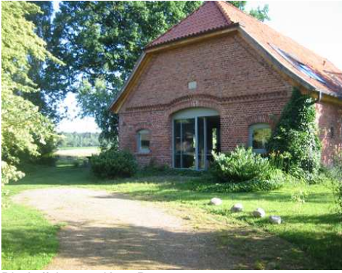
Die Auffahrt zum KunstRaum