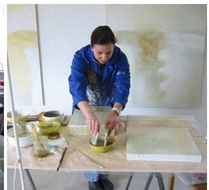
Kursteilnehmerin beim Farbmischen

Der erste Maltag endet mit dem Abendessen gegen 19 Uhr – danach besteht die Möglichkeit, ohne Anleitung weiter zu malen.