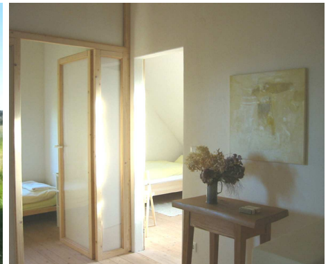
Blick aus dem Gästeflur in die Gästezimmer im DG