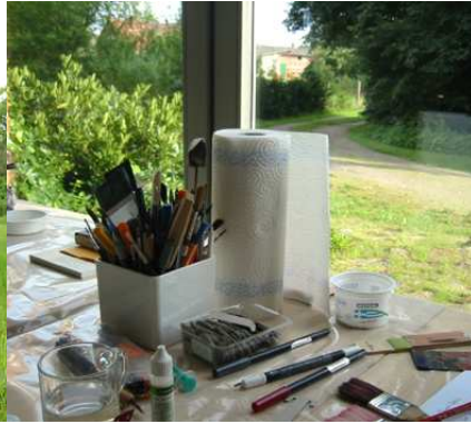
Maltisch vor dem Atelierfenster