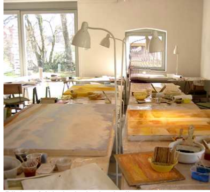
Blick auf Arbeitstische im Atelierraum