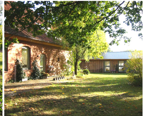
Westseite des Haupthauses mit Werkstattgebäuden