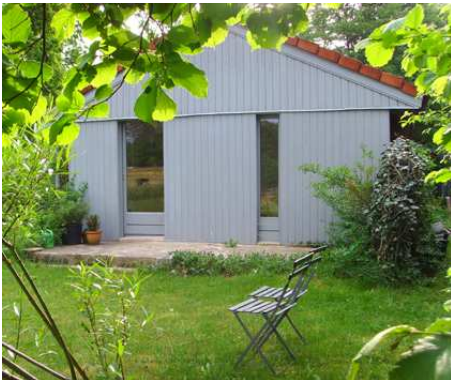
Casetta, das kleine Gästehaus im Garten