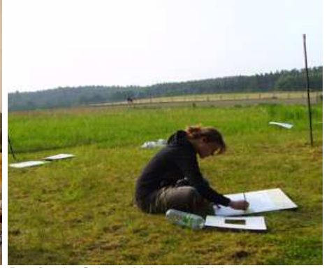
Draußen im Gelände Malen und Zeichnen