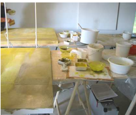
Blick auf einen der Maltische

Der Samstag beginnt nach einem gemeinsamen Frühstück (zwischen 8.00 und 9.00 je nach Wunsch der Teilnehmer) mit den ersten Farbschichtungen, Mittagspause und Kaffeepause unterbrechen die Arbeiten.