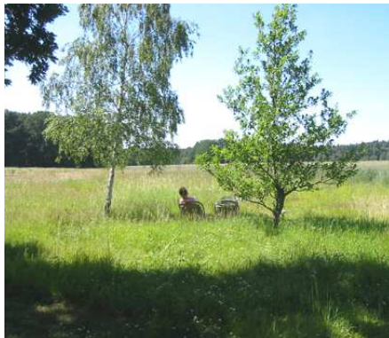
Ausspannen im weitläufigen Gelände